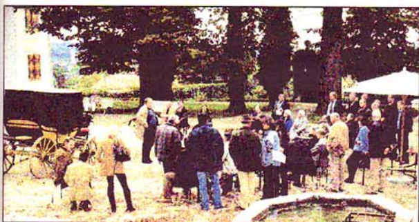
Im Innenhof des Schlosses Waldegg bei Solothurn trafen sich Fahrkultur-Freunde.